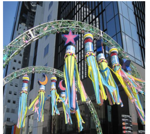
→梅田スカイビル 七夕飾り