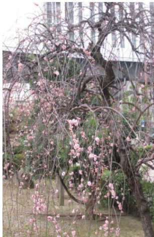
← 済生会中津病院前 正面玄関前

春まだ浅い候ではありますが、寒さの中にも日差しが温もりや、木々の芽を見やると春を感じる今日この頃です。 日頃は中津デイサービスセンターにご理解・ご協力頂き感謝申し上げます。 世間はインフルエンザや流行中の麻疹、北海道地震など心配な情報が沢山ですが、だんだんと春が近づくと心が弾む思いになります。済生会中津病院前の中庭にも美しいピンク色のしだれ梅が開花しています。お立ち寄りの際には是非ご覧下さいね。