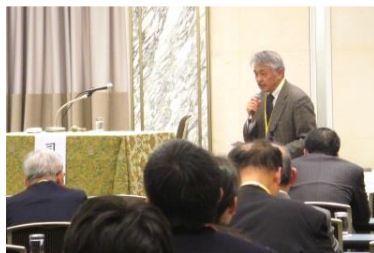
大淀医師会 柏井副会長 ご講評