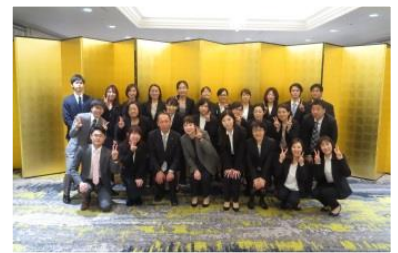
地域医療連携センター スタッフ