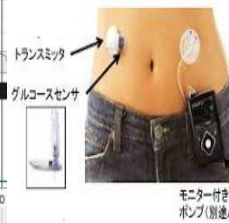
モニター付きインスリンポンプ(別途A2申請)