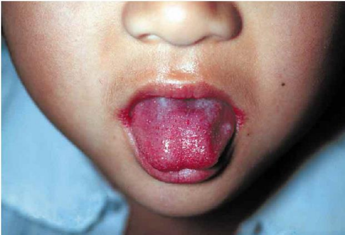
写真：A群溶血性レンサ球菌咽頭炎による莓舌

発熱開始後12～24時間すると点状紅斑様、日焼け様の皮疹が出現して猩紅熱と呼ばれる病態を呈することがあります。針頭大の皮疹により、皮膚が紙ヤスリ様の手触りとなる事が特徴的です。この場合、通常顔面には皮疹はなく、額と頬が紅潮し、口の周りのみ蒼白にみえる（口囲蒼白）とされています。