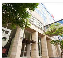
会場 南棟2F 講堂