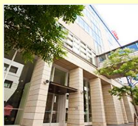
会場 南棟2F 講堂