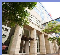
会場 南棟2F 講堂