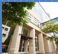
会場 南棟2F 講堂