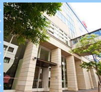
会場 南棟2F 講堂