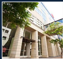
会場 南棟2F 講堂