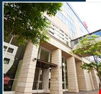
会場 南棟2F 講堂