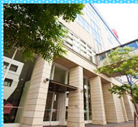
会場 南棟2F 講堂