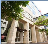
会場 南棟2F 講堂